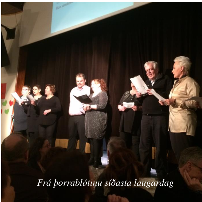
Frá þorablótinu síðasta laugardag

Á sveitarstjórnarfundi í gær var farið yfir stöðu fráveitumála í sveitarfélaginu en unnið hefur verið að þeim á vegum umhverfisráðuneytisins og sveitarfélagsins undanfarin misseri. Beðið er eftir skýrslu frá EFLU og þá munu sveitarstjóri og oddviti hitta umhverfisráðherra og starfsmenn ráðuneytisins í næstu viku vegna málsins til að fylgja því eftir. Mikilvægt er að koma á öflugu hreinsikerfi við Mývatn en eins og áður hefur komið fram er það sveitarfélaginu ofviða fjárhagslega enda kostnaðurinn á pari miðað við ársveltu sveitarfélagsins, sé bara miðað við Reykjahlíð. Á síðasta ári bárust fréttir um að skýr þverpólítískur vilji væri fyrir því á Alþingi að bregðast við ástandinu í Mývatni með því að styðja við bakið á Skútustaðahreppi til að koma frárennslismálum við vatnið í ásættanlegt horf.