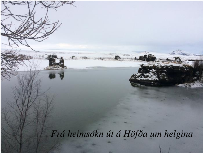
Frá heimsókn út á Höfða um helgina