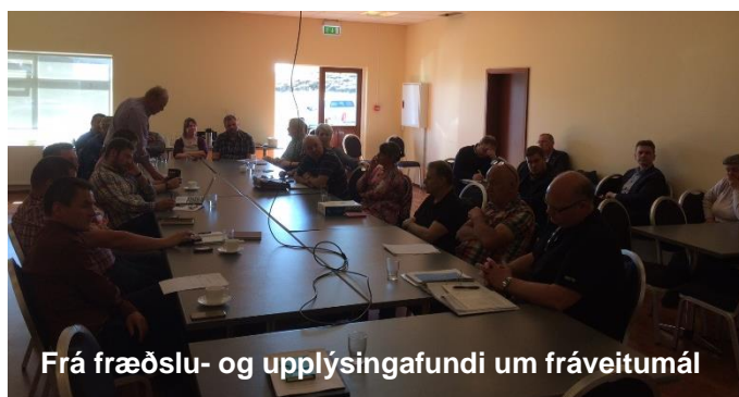
Frá fræðslu- og upplýsingafundi um fráveitumál