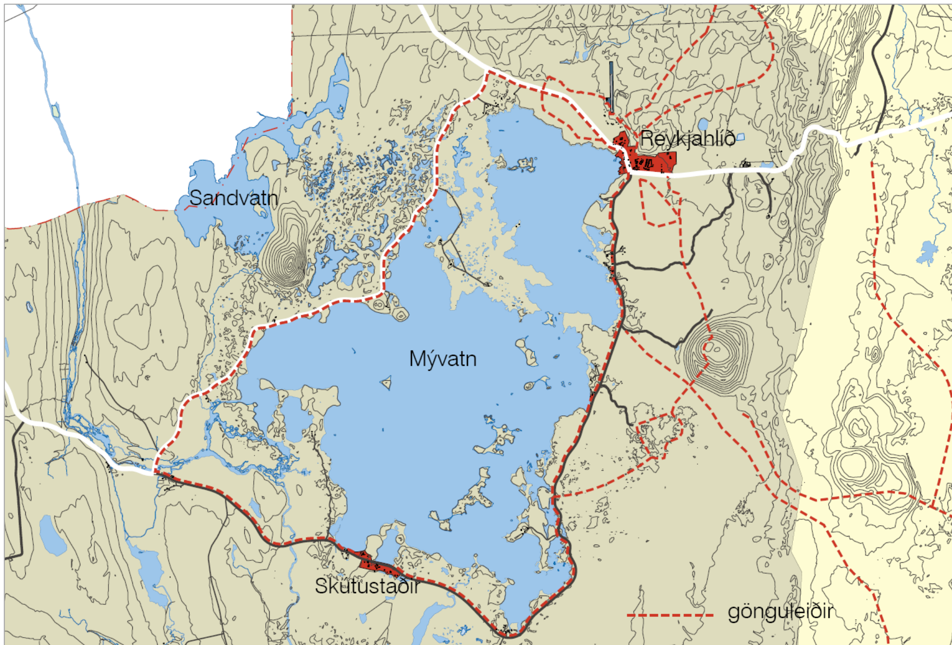
Mynd 6.3 Gönguleiðir í sveitinni