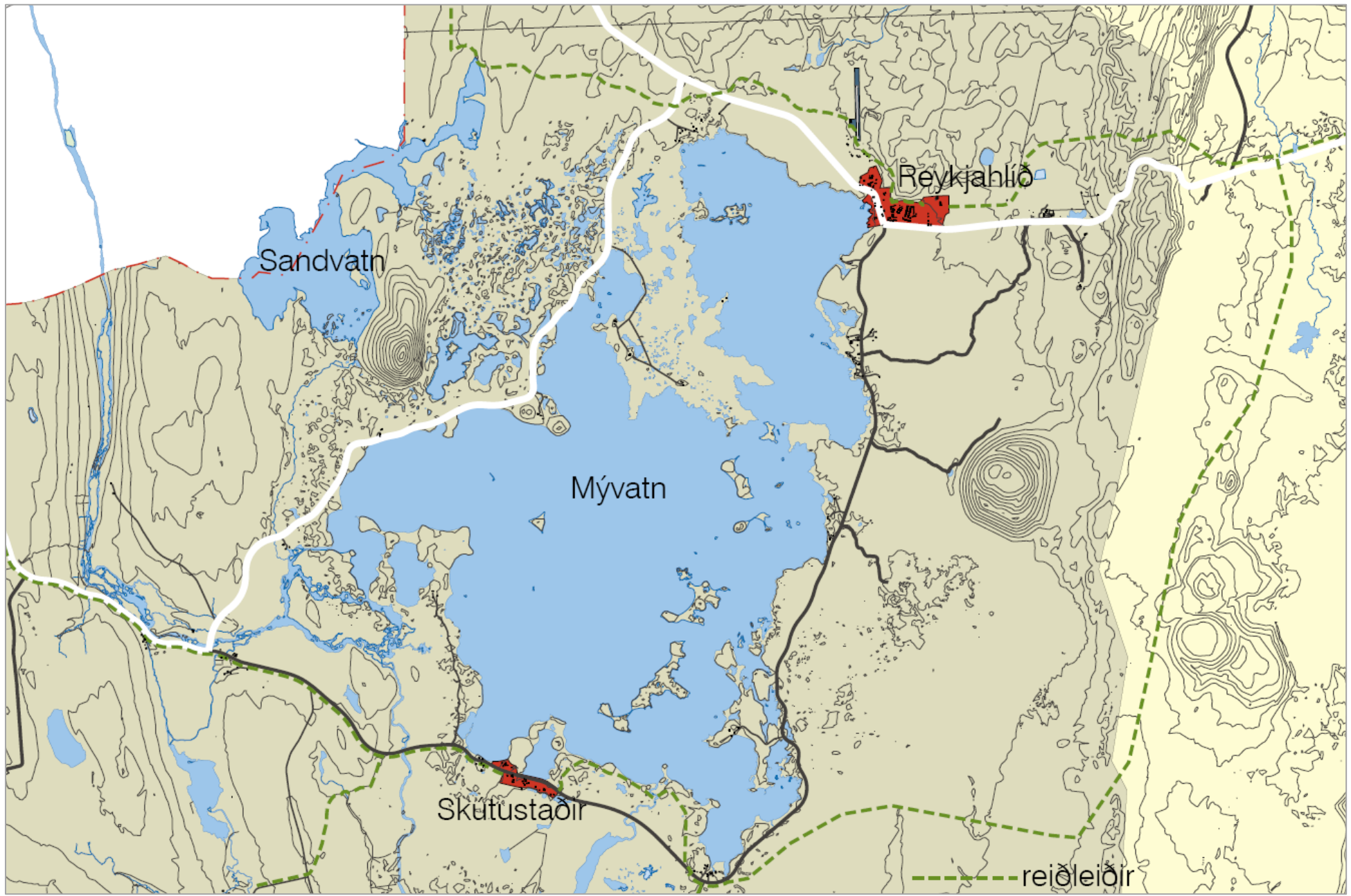
Mynd 6.4 Reiðleiðir í sveitinni