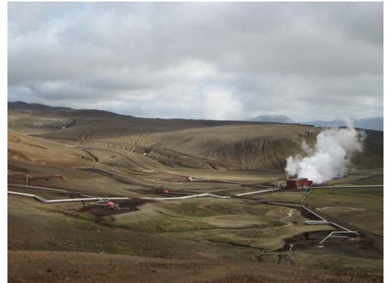
Mynd 6.5 Kröfluvirkjun.

Um sveitarfélagið liggja meginflutningslínur Landsnets milli landshluta. Þær tengjast tengivirki í Kröflustöð. Kröflulína 1, 132 kV liggur til vesturs sunnan Hlíðarfjalls og norðan byggðar í Reykjahlíð.