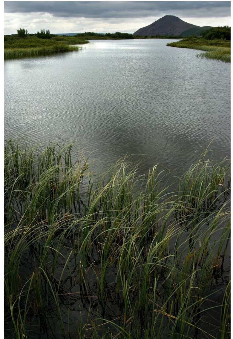
Mynd 1.4 Votlendi í Vindbelgjarskógi. Vindbelgur í bakgrunni.