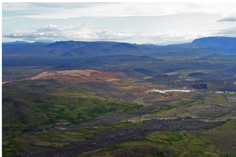
Mynd 1.2 Útsýni af Hlíðarfjalli