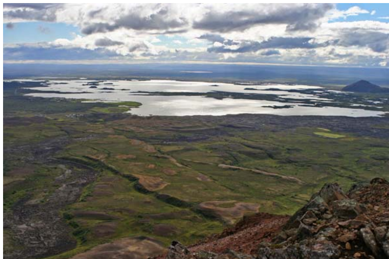
Mynd 1.1 Mývatn. Útsýni af Hlíðarfjalli