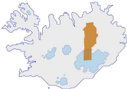
Mynd 1 Skútustaðahreppur

Aðalskipulag Skútustaðahrepps 2010-2021 verður unnið af starfsmönnum Teiknistofu arkitekta Gylfi Guðjónsson og félagar ehf. í samráði við sveitarstjórn Skútustaðahrepps.