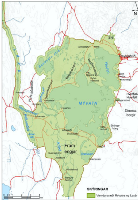
Mynd 3. Verndarsvæði Mývatns og Laxár